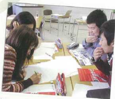
「働くこと」をシミュレーションできるグループワークで、仕事への理解が深まる！