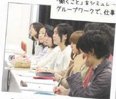
「企業で働く」って、どんなやりがいがあるんだろう？ 熱心に耳を傾ける熊大生！