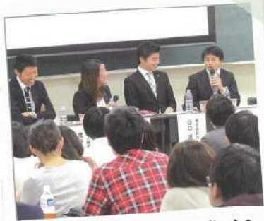
様々な仕事を経験した企業担当者からの熱いメッセージで、働くことの「本音」が伝わる！