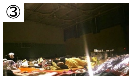
①避難した子どもたちからのお手紙 ②体育館エントランスでの炊き出し ③体育館での雑魚寝 (いずれも熊本地震の際)