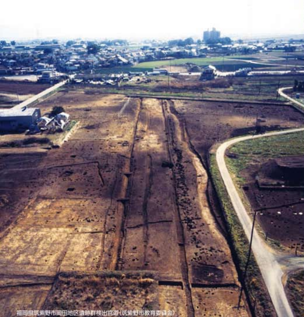
福岡県筑紫野市岡田地区遺跡群検出官道

熊本大学黒髪キャンパスでは、古代の国府と大宰府を結ぶ官道と思われる道が発見されています。九州各地に廻らされた通信・交通網の実態について、構内遺跡を出発点として考えてみます。