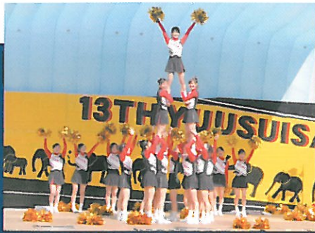
11月1日(土)~3日(月・祝)は、黒髪キャンパスで大学祭「熊祭」も開催中です